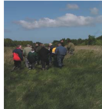
Naturtur i blæst i Tolshave mose

Der var også et væld af andre insekter at se på, trods at skyer og blæst.