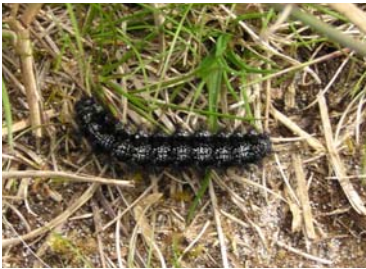
Larve af Hedepletvinge - forår

Finder du ikke den flyvende sommerfugl, kan du gå på larvejagt i august - oktober.