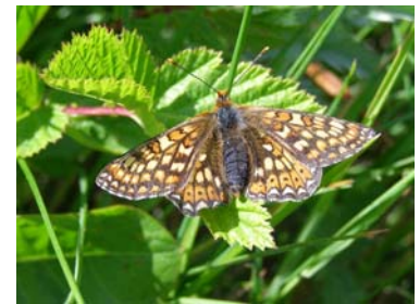
Hedepletvinge – overside

Hedepletvinge flyver normalt i ca. tre uger fra slutningen af maj til Sct. Hans. Det kolde forår i år har forsinket den lidt. Derfor kan du stadig nå at se Hedepletvinge flyve i naturen, hvis du er heldig.