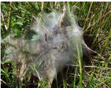
Larvespind på Djævelsbid

Der er størst chance for at finde larverne, hvor der er mange Djævelsbid, der står i lav vegetation på solrige steder. Hedepletvingens larver findes nemmest fra midten af august til starten af september. I den periode, vil de Djævelsbid der huser larver, være gule på stænglen, fordi larverne har gnavet i barken.