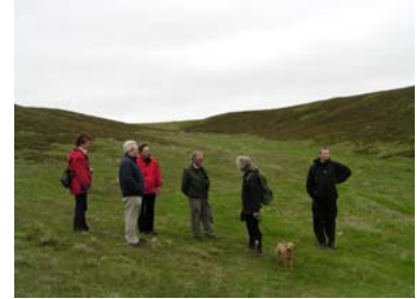
Deltagerne på tur på Lundby Hede